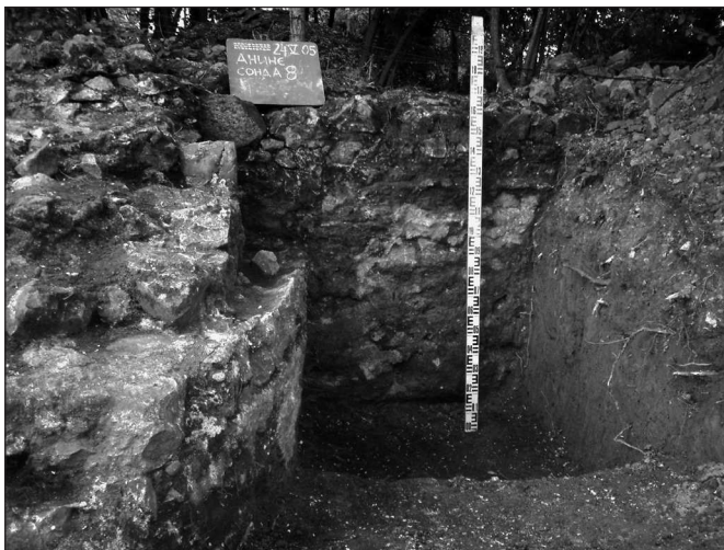
Слика 5 Figure 5

т. Дужом страном оријентисана је у правцу северозапад – југоисток. Зидови, ширине 1,3 м, очувани су до висине од 1,5 м. Са спољне стране откривени су пиластри (0,8 x 0,6 м), а у унутрашњости се налазио земљани под. Ова и суседна зграда вероватно представљају економске објекте, можда житнице. Остаци грађевина веома добро су очувани до висине од 1,5 м (сл. 5).