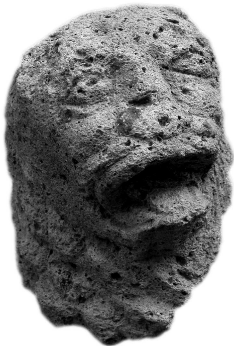
Слика 6 Figure 6

Најбројнију скупину налаза током истраживања 2005. године чини нумизматички материјал. Сондирањем терена у првој половини године откривено је 158 комада металног новца из римског раздобља. Случајни налази, углавном површински, који су махом детектовани приликом обиласка терена, сачињавају скупину која броји 170 целих и 26